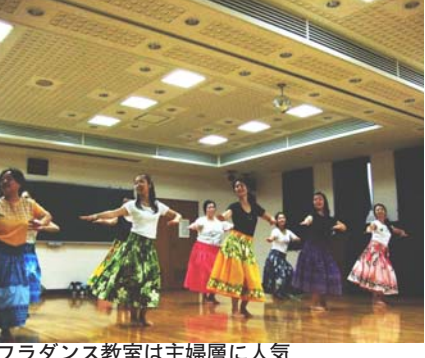
▲フラダンス教室は主婦層に人気

他のスタジオオーナーとしても「ダンス上げる場合も基本的なスケルトン貸しで、講師が借りないといけない。し