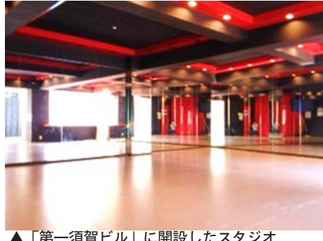
▲「第一須賀ビル」に開設したスタジオ